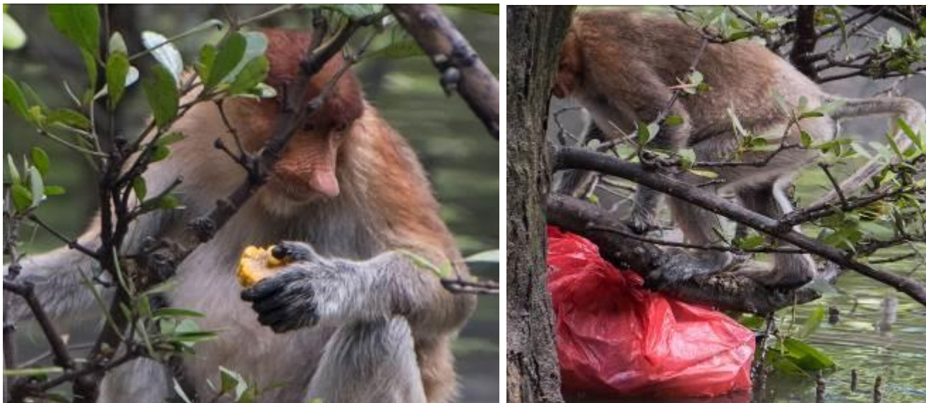
Kahau na okraji města Balikpapanu se začínají živit lidskými odpadky.

Při letošním sčítání tým použil nový nástroj, termovizi, která umožňuje pozorovat opice i v noci. Počítat opice klidně usazené na svých spacích pozicích v korunách stromů, je o poznání snazší než sčítat aktivní zvířata, která se před pozorovatelem během dne často ustupují a skrývají se v korunách stromů. Ve srovnání s předchozími lety je letošní proto sčítání proběhlo mnohem rychleji.