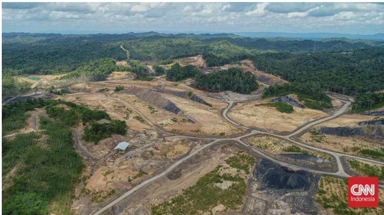
Těžba hnědého uhlí na území budoucího hlavního města Indonésie je zatím stále ještě aktivní

National Capital Authority nyní inventarizuje těžební jámy v okolí hlavního města, včetně doposud aktivních licencí. Všechny těžební jámy by měly být v budoucnu rekultivovány.