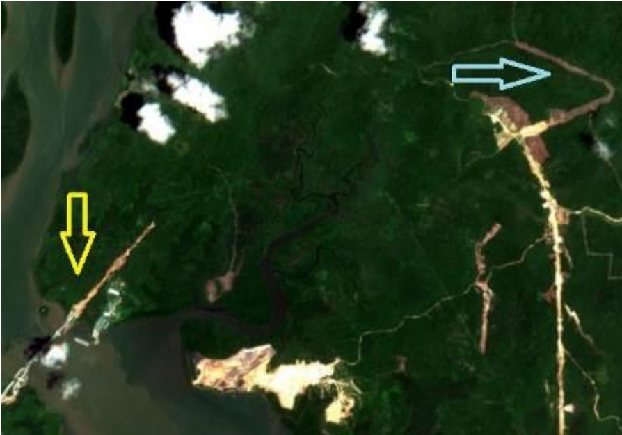
Žlutá šipka ukazuje most na ostrov Balang, zatímco modrá šipka označuje změněnou trasu výstavby spojovací silnice

Vidina výstavby hlavního města vedla k obnovení výstavby silnice k ostrovu Balang, která již téměř 30 let považována jeden z nejdestruktivnějších projektů v celé oblasti, neboť izoluje pobřeží zálivu od posledních zbytků primárního deštného lesa v rezervaci Sungai Wain. Na stavenišť se vrátila těžká technika a ničení lesa rychle postupuje. O silnici se nyní začalo mluvit jako o dálnici hlavního města. Došlo navíc ke změně trasy, která je nyní delší a ještě více se přiblížila rezervaci Sungai Wain. Důvody pro změnu trasy nebyly nikdy objasněné, ale zá se, že se v rámci urychlení stavby a snížení nákladů investor vyhýbá, pozemkům, které si nárokují spekulanti.