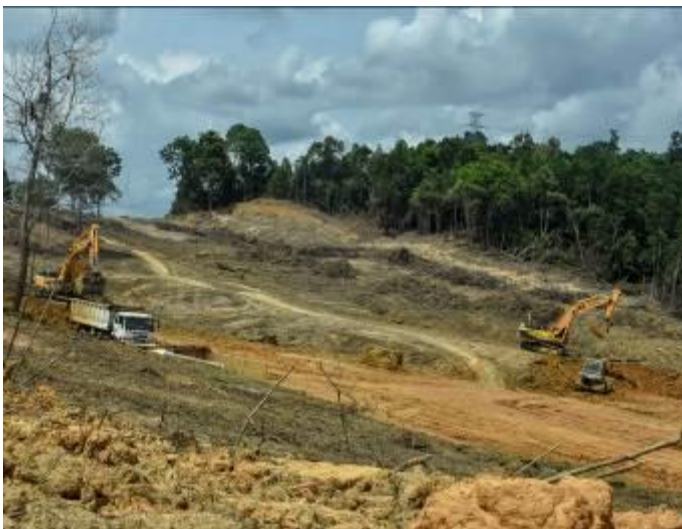
Těžká technika rychle likviduje les, který stojí v cestě nové silnici.