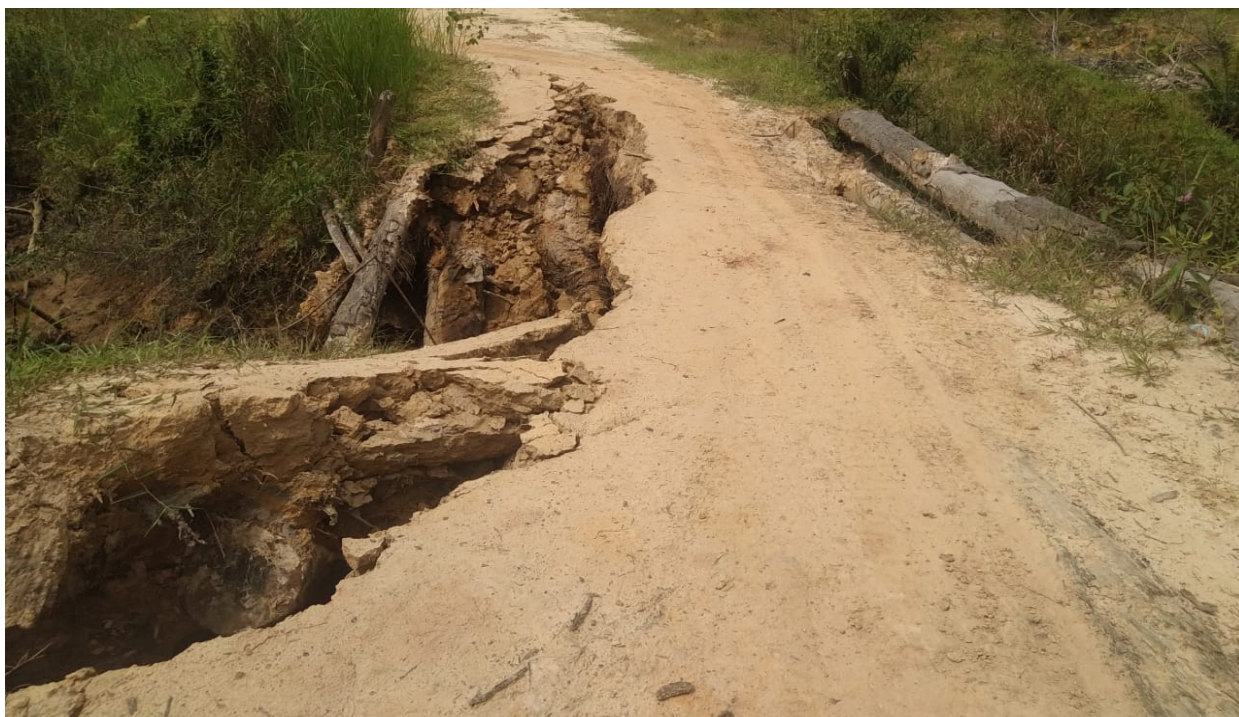
Rozestavěná silnice k mostu přes ostrov Balang je zdrojem sedimentu, která zanáší horní toky řek