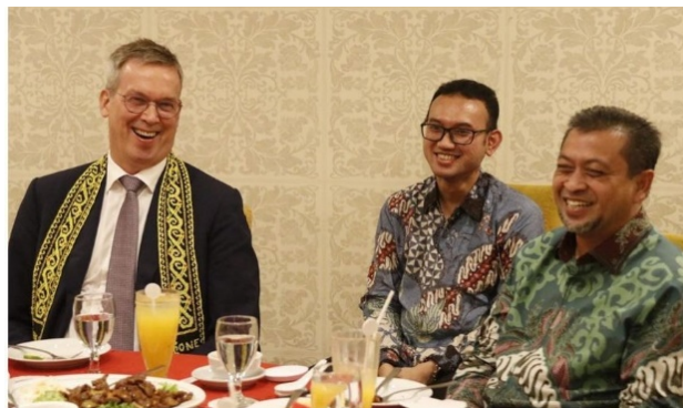
Velvyslanec EU Vincent Piket při své oficiální návštěvě

Ani Evropská Unie nezůstává pozadu a hlásí se o svůj díl koláče. Evropský velvyslanec Vincent Piket při své návštěvě Východního Kalimantanu a schůzce se zástupcem guvernéra vyjádřil zájem evropských investorů o účast na výstavbě hlavního města. Účast Evropské Unie na tomto problematickém projektu je sice poněkud zahanbující, znamená však i určitou naději pro zapojení mezinárodní ochránářské komunity