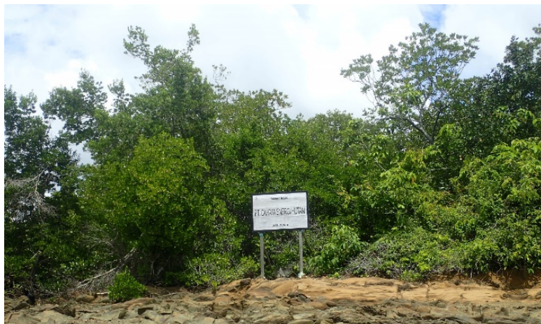
Na plánovanou výstavbu továrny nás upozornila až tato cedule

Při pobřeží zálivu jsem zcela nečekaně objevili novou ceduli s názvem korporace PT Cahaya Energi Hutani, který se neobjevuje v žádném z předchozích dokumentů územního plánování. Ukázalo se, že tato korporace v tichosti získala povolení k výstavbě továrny na výrobu briket z dřeva rychle rostoucích nepůvodních stromů, jako jsou akácie. Pro účel výstavby má být zničeno asi 25 hektarů pobřežního lesa s vysokou