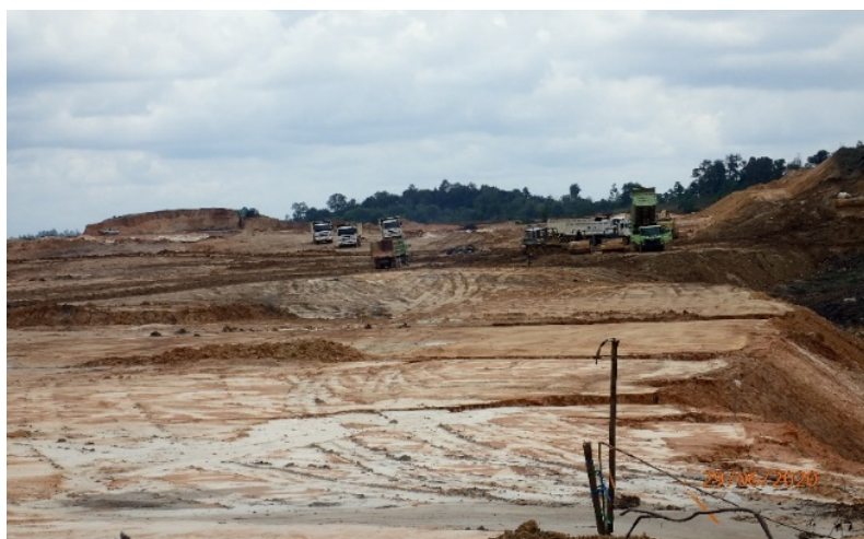
Likvidace pobřežních prelesů před tím, než RSPO nařídil pozastavení výstavby plánované rafinerie palmového oleje

Konzultant, kterého RSPO najal kvůli přehodnocení vlivu projektu na životní prostředí (EIA) navštívil i naši kancelář v Balikpapanu, kde se sešel se zástupci dvou místních organizací, které se podílejí na protest proti výstavbě rafinerie. V dokumentu, který konzultant pro RSPO připravil a ve kterém doporučuje povolení výstavby, pak uvádí, že tyto organizace “v principu nic nenamítají proti výstavbě rafinerie za předpokladu, že nedojde k poškození přírodního a sociálního prostředí.” Obě organizace se nyní cítí být zneužity, a obrátili se proto v dopise k RSPO s žádostí na nápravu. Konzultant na tuto stížnost neodpověděl. Výstavba rafinerie však zůstává nadále pozastavena.